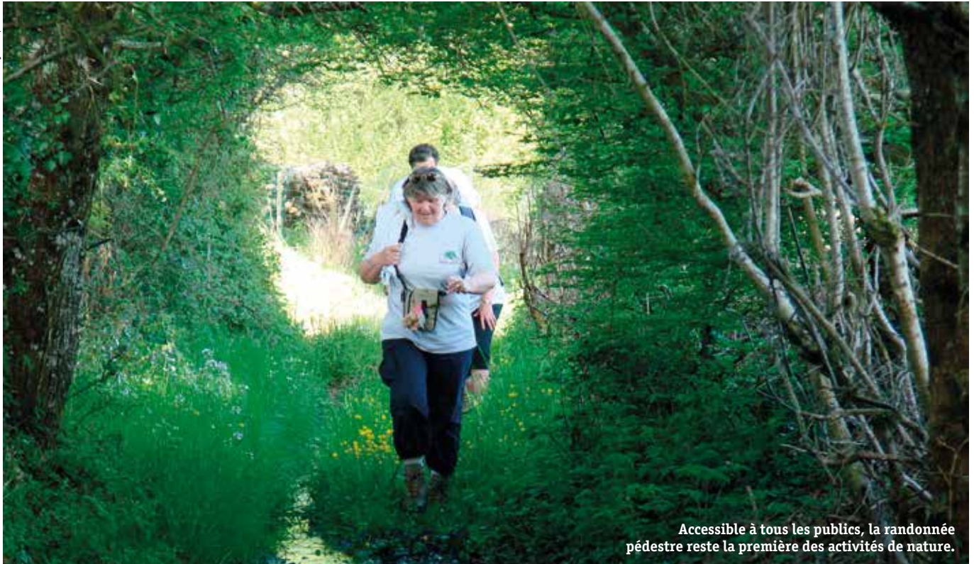
Accessible à tous les publics, la randonnée pédestre reste la première des activités de nature.