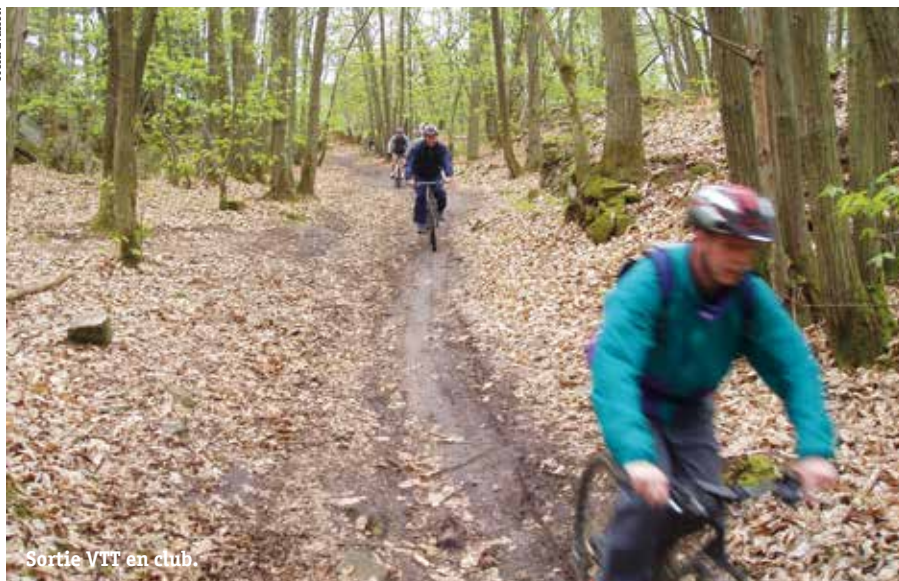
Sortie VTT en club.

Aujourd'hui, le paysage des sports de nature offre une image paradoxale : jamais autant de personnes n'ont revendiqué l'accès aux sports de nature, et jamais le lien avec celle-ci n'a été aussi distendu. La notion même de « sport de nature » est devenue très floue... « Les espaces dans lesquels les pratiques se déroulent sont de plus en plus institutionnalisés, aménagés,